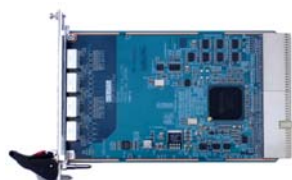
DCP-571-PbF (CompactPCI 規格)