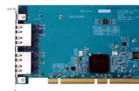
DPC-573-PbF (PCI 規格)

本社: 〒168-0074 東京都杉並区上高井戸 1-25-16 TEL 03(3329)3871 (代) FAX 03(3329)9266 大阪営業所: 〒564-0063 大阪府吹田市江坂町 1-13-41 TEL 06(6330)0333 (代) FAX 06(6330)2691